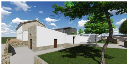
Empreitada da Casa Mortuária de Melgaço