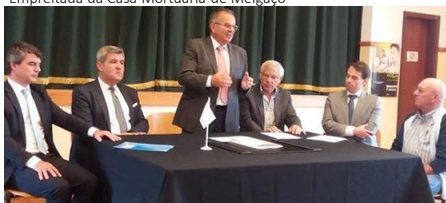
Centro de Desenvolvimento Comunitário do Landal

Ao abrigo do Programa de Equipamentos Urbanos de Utilização Coletiva, foram assinados contratos de Financiamento entre a DGAL, CCDR's dos respetivos territórios e diversas entidades, constantes do quadro seguinte: